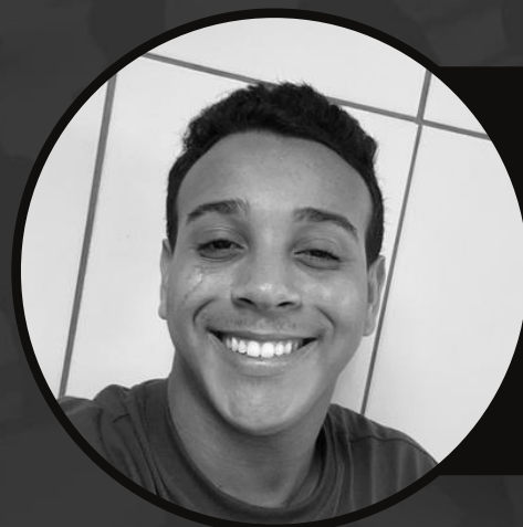
PHELIPPE REFERENCIADO Bauru